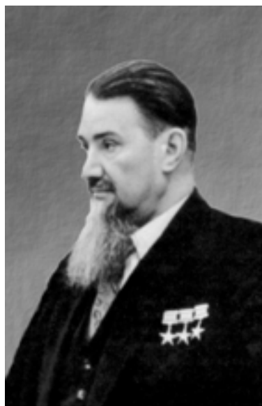
Курчатов Игорь Васильевич

Тем временем в одном из городов Урала большой группой ученых интенсивно разрабатывался ядерный заряд. Уже в июне 1946 года Юлием Борисовичем Харигоном в Совет Министров для утверждения была представлена конструкция первой атомной бомбы.