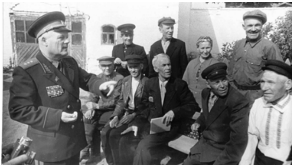
Беседа Филлипа Ивановича Голикова с боевыми товарищами полка «Красные Орлы»