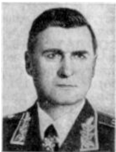
Соколовский Василий Данилович

Так, в канун праздника 40-й годовщины Советской Армии и Военно-Морского Флота в Большом Кремлевском дворце состоялся бал, на котором молодые воины Советской Армии и Военно-Морского Флота встретились с юношами и девушками столицы.