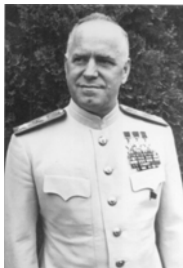
Жуков Георгий Константинович

На посту командующего Одесским военным округом Жуков проявил себя как военачальник-новатор. Он творчески решил все вопросы организации боевой под-