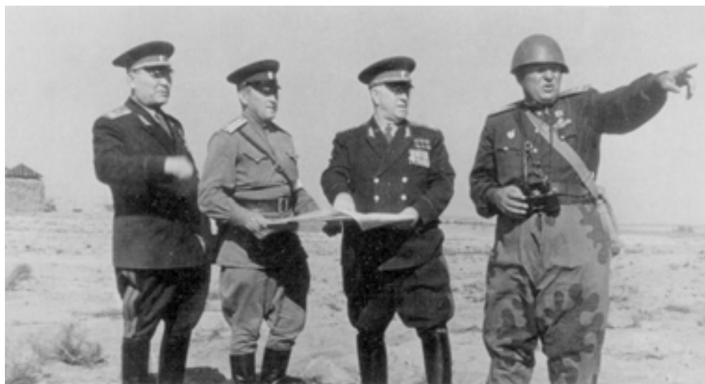
Маршал Советского Союза Жуков Георгий Константинович руководит учениями на Тоцком полигоне. 1954 год

кой защите. Выдали памятки по защите от оружия массового поражения, в которых излагалось, как действовать при взрыве атомной бомбы.