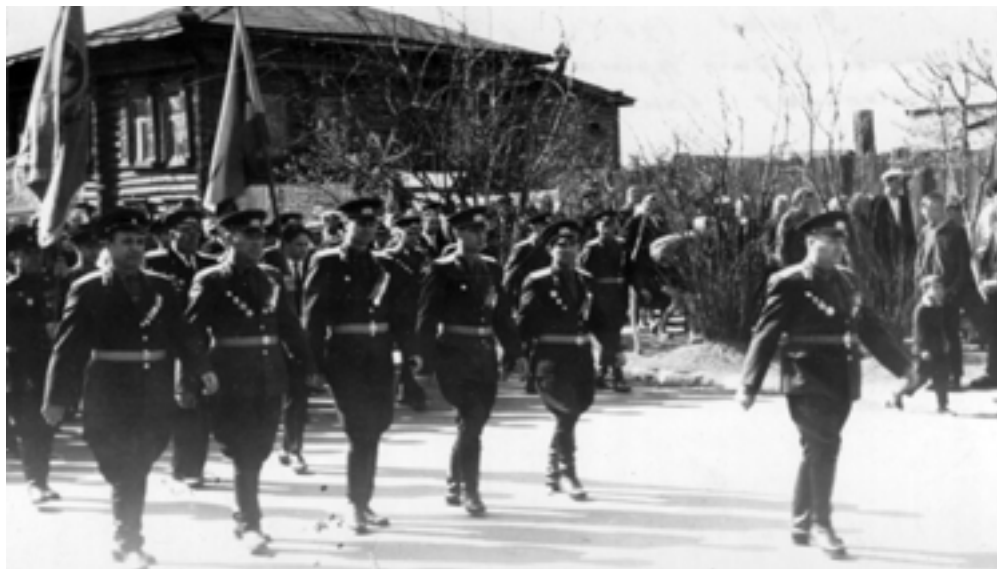
Офицеры городского военного комиссариата, фронтовики на первомайской демонстрации