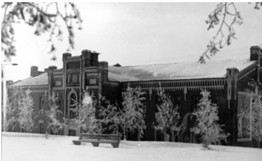
Здание Челябинского автотракторного училища