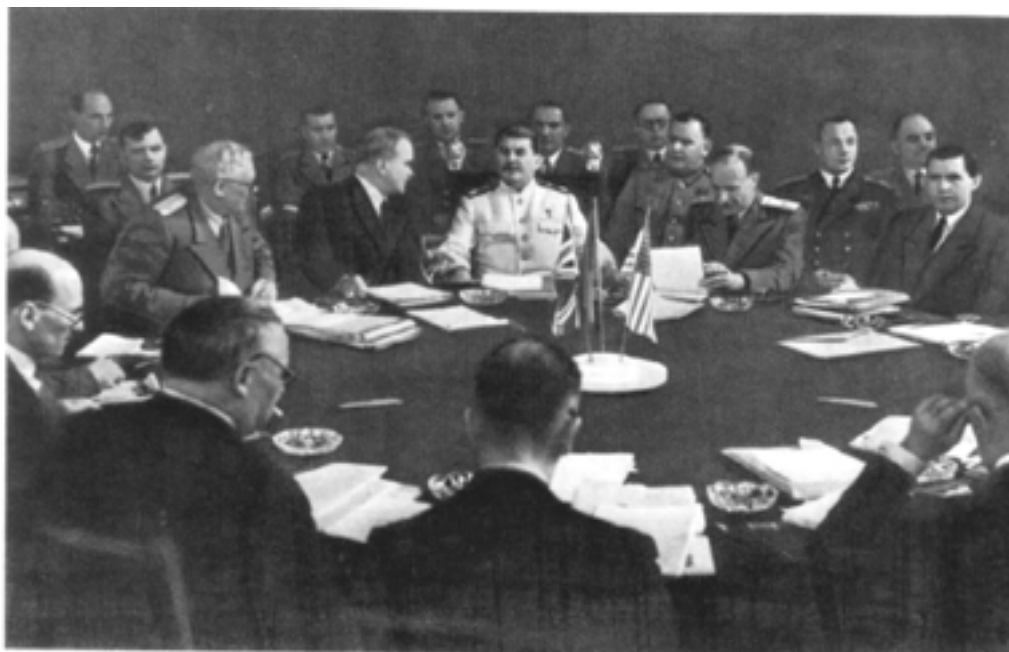
Заседание «Большой тройки» на Потсдамской конференции

Война в Европе окончилась. Рассмотрению вопросов, возникших из коренного изменения политической обстановки, была посвящена последняя встреча «Большой тройки» - Потсдамская конференция, проходившая с 17 июля по 2 августа 1945 года. СССР на конференции представлял Иосиф Виссарионович Сталин, США - президент Гарри Трумэн, только что сменивший его на этом посту умершего Франклина Рузвельта, Великобританию - сначала премьер - министр Уинстон Черчилль, а затем, после победы на выборах, новый премьер-министр Клемент Эттли.